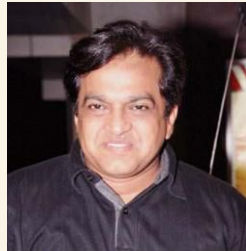
ਵਿਵੇਕ ਸ਼ੇਕ ਦੀ ਪੁਰਾਣੀ ਤਸਵੀਰ

ਹੱਸਣਾ ਤੇ ਹਸਾਉਣਾ ਜੀਵਨ ਦੇ ਸਿਹਤਮੰਦ ਹੋਣ ਦੇ ਨਾਲ-ਨਾਲ ਰੂਹ ਨੂੰ ਇੱਕ ਵੱਖਰਾ ਸਕੂਨ ਦੇਣ ਦੀ ਵੀ ਕਲਾ ਹੈ। ਪ੍ਰੰਤੂ ਅੱਜ ਅਸੀਂ ਆਪਣੇ ਰੁਝੇਵਿਆਂ ਭਰੀ ਜਿੰਦਗੀ ਵਿੱਚ ਇੰਨੇ ਗੁੰਮ ਹੋ ਚੁੱਕੇ ਹਾਂ ਕਿ ਆਪ ਤਾਂ ਕੀ ਹੱਸਣਾ ਸੀ ਦੂਜਿਆਂ ਦੇ ਹਾਸੇ ਖੇਡਣ ਤੇ ਦਿਨ ਰਾਤ ਲੱਗੇ ਹਾਂ। ਅੱਜ ਦੇ ਸਮੇਂ ਵਿੱਚ ਹੱਸਣਾ ਸਾਡੀ ਜਿੰਦਗੀ ਵਿੱਚੋਂ ਬਿਲਕੁੱਲ ਗੁੰਮ ਹੋ ਚੁੱਕਾ ਹੈ, ਹਾਸਿਆ ਦੀ ਜਗ੍ਹਾ ਸਿਰਫ਼ ਬੁੱਲਾ ਵਿੱਚ ਮੁਸਕਰਾਉਣਾ ਹੀ ਰਹਿ ਗਿਆ ਹੈ, ਉਹ ਮੁਸਕਰਾਹਟ ਵੀ ਨਕਲੀ। ਪ੍ਰੰਤੂ ਕੁਝ ਕੁ ਲੋਕ ਦੁਨੀਆ ਵਿੱਚ ਅਜਿਹੇ ਹੁੰਦੇ ਹਨ ਜਿਨ੍ਹਾਂ ਦੇ ਜੀਵਨ ਦਾ ਮਕਸਦ ਹੀ ਦੁਸਰਿਆਂ ਨੂੰ ਖੁਸ਼ੀ ਦੇਣਾ ਅਤੇ ਹੱਸਾਉਣਾ ਹੁੰਦਾ ਹੈ। ਅਜਿਹੇ ਹੀ ਇੱਕ ਫਨਕਾਰ ਅਦਾਕਾਰ ਵਿਵੇਕ ਸ਼ੇਕ ਨੂੰ ਅਸੀਂ ਅੱਜ ਯਾਦ ਕਰ ਰਹੇ ਹਾਂ। ਜਿਸ ਨੇ ਪੂਰੀ ਉਮਰ ਪੰਜਾਬੀਅਤ ਦੀ ਸੇਵਾ ਕਰਦੇ ਹੋਏ ਆਪਣੀ ਇੱਕ